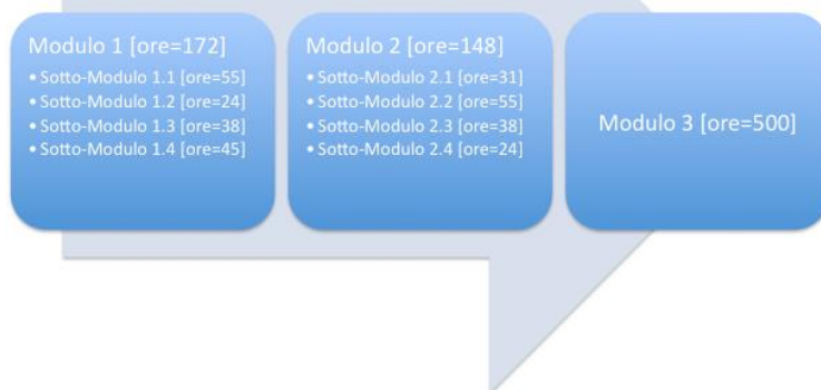
Figura: Sequenza dei Moduli didattici